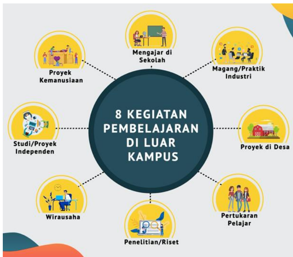
Gambar 1. Delapan contoh kegiatan MBKM yang dapat dipilih oleh mahasiswa untuk memenuhi hard skill dan soft skill sebagai bekal menuju masa depan.

kerja, atau justru menciptakan lapangan kerja. Proses pembelajaran dalam program MBKM merupakan bentuk pengejawantahan kegiatan belajar mengajar yang berpusat pada mahasiswa ( student centered learning ) yang sangat hakiki. Proses pembelajaran melalui MBKM memberikan tantangan sekaligus kesempatan untuk mengembangkan inovasi, kreativitas, kapasitas, kepribadian, dan jati diri mahasiswa, serta mengembangkan kemandirian dalam mencari, menemukan, dan meramu pengetahuan yang diperoleh melalui kehidupan nyata sehari-hari. Kenyataan dan dinamika dalam dunia usaha dan dunia industri (DUDI) seperti kemampuan memahami permasalahan nyata, interaksi sosial, kolaborasi, manajemen diri, tuntutan kinerja, serta penentuan target menjadi tuntutan saat ini. Program MBKM yang dirancang dan diterapkan dengan baik, akan menghasilkan hard skill dan soft skill mahasiswa yang baik pula. Program MBKM ini diharapkan dapat menjawab tantangan Perguruan Tinggi di Indonesia untuk menghasilkan lulusan yang sesuai dengan perkembangan zaman, kemajuan IPTEK, tuntutan dunia usaha dan dunia industri (DUDI), maupun dinamika kehidupan masyarakat masa kini.